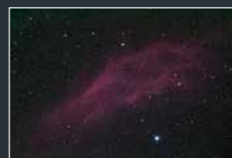
D810: Filtro ottico normale (IR-cut)

La D810A monta sul sensore un filtro ottico IR-cut contraddistinto da una capacità di trasmissione della luce appositamente studiato per l'astrofotografia. Con una fotocamera digitale classica, la trasmissione di luce rossa nella gamma del visibile viene limitata per riprodurre come da percezione visiva i colori dei soggetti tradizionali, e ciò va ad influire anche sulla sensibilità nella linea spettrale dell'H-alpha (lunghezza d'onda: 656,28 nm) che si trova all'interno di questo intervallo. Le nebulose che emettono energia in questa lunghezza d'onda possono essere, quindi, fotografate con difficoltà e con colori poco saturi utilizzando una fotocamera tradizionale. Al contrario, il filtro ottico (filtro IR-cut) della D810A vanta un'elevata trasmissione della luce rossa anche nella gamma del visibile, molto vicino all'infrarosso. Come risultato, la capacità di trasmissione della luce nella riga di spettro dell'H-alpha è stata aumentata di circa quattro volte, rispetto alla D810, consentendo così di riprodurre il colore rosso delle nebulose che emettono radiazioni nella lunghezza d'onda dell'H-alpha in maniera eccellente esattamente come gli astrofotografi si aspettano.