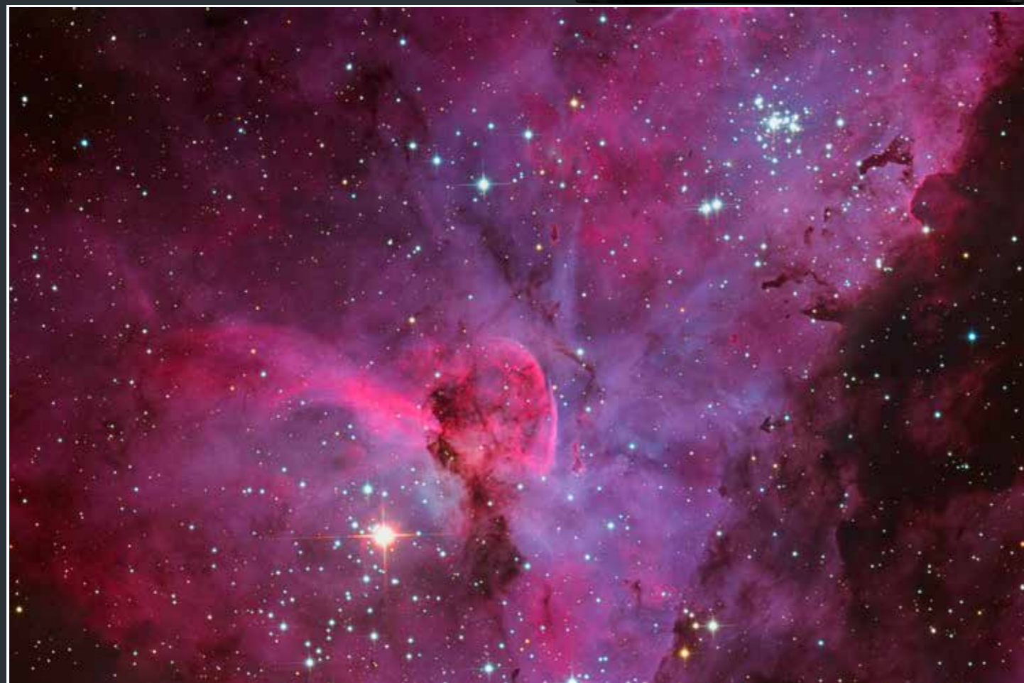
• Nebulosa della Carena (Eta Carinae) • Telescopio: configurazione Cassegrain con specchio da 80cm di diametro f/7 (lunghezza focale pari a 5.600mm) • Correttori ottici: N/A • Montatura equatoriale: Forcella da 32" • Qualità dell'immagine: 14-bit RAW (NEF) • Modo di esposizione: [M] manuale • Sensibilità: ISO 400 / ISO 800 • Tempo di esposizione per singola immagine e numero complessivo di immagini sommate: 300s x 5 immagini / 300s x 3 immagini