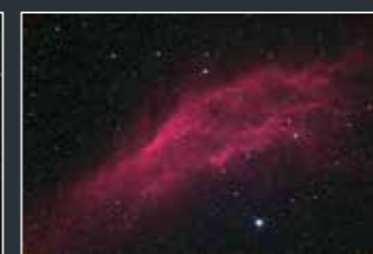
D810A: Filtro ottico (IR-cut) compatibile con la lunghezza d'onda dell'H-Alpha