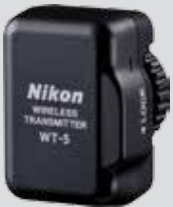
Trasmettitore Wi-Fi Nikon WT-5