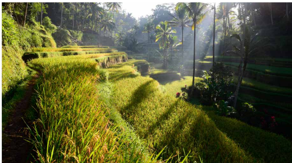
Alex Soh: Nikon D750 con obiettivo AF-S NIKKOR 24mm f/1.8G ED